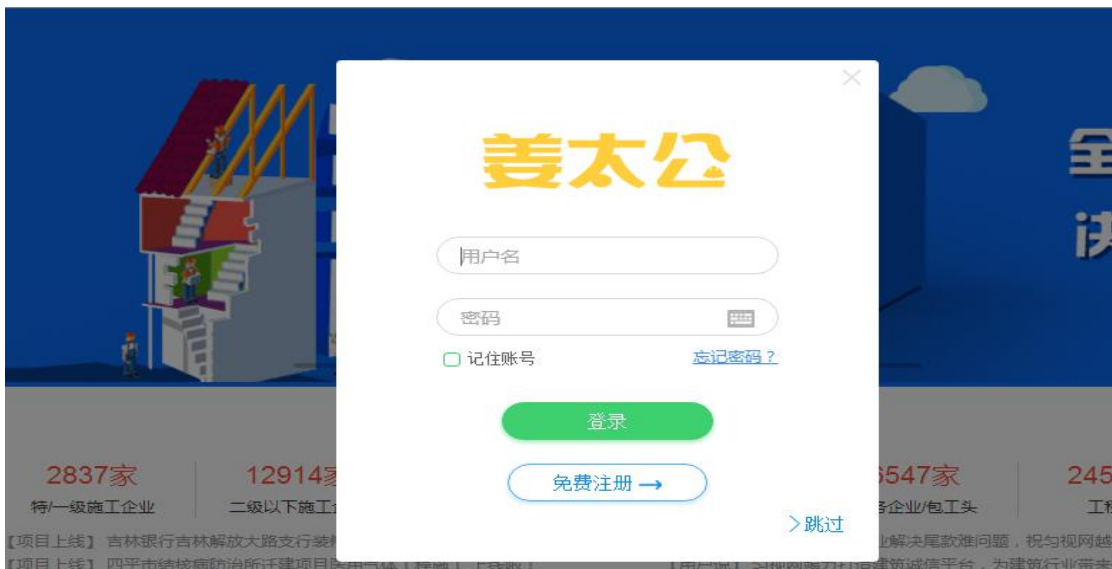
图 6 注册