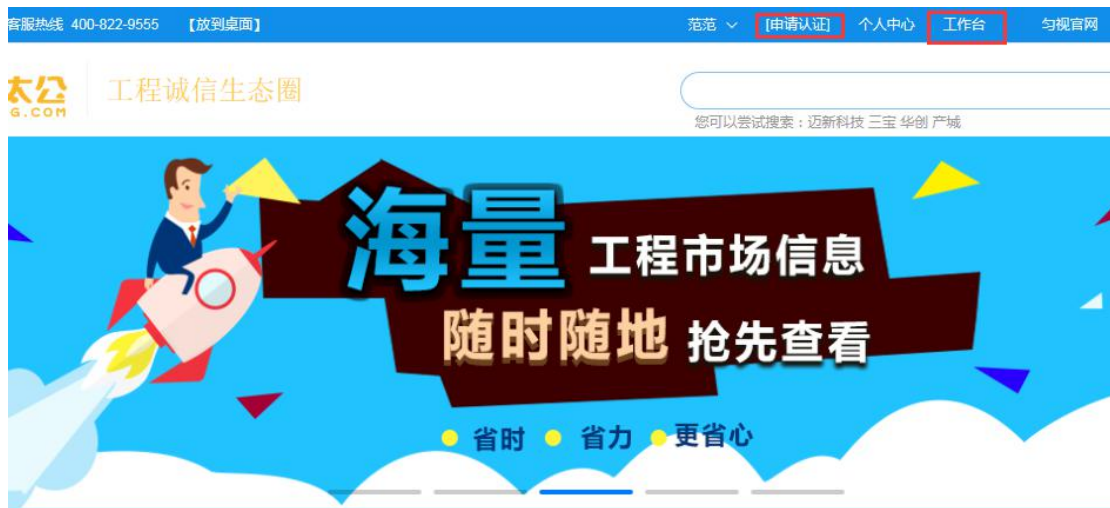
图 1 认证