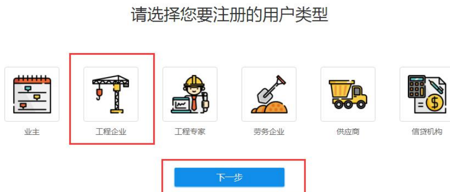
图 2 注册