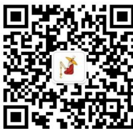
扫码关注姜太公网