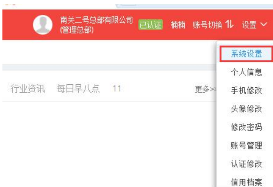
图 4 初始化岗位信息

若企业内部组织架构以及人员配置较为复杂，可在设置-系统设置里面进行员工权限配置， 注册账号（管理员账号）享有全部审批权限 ，其他员工账号不享有。