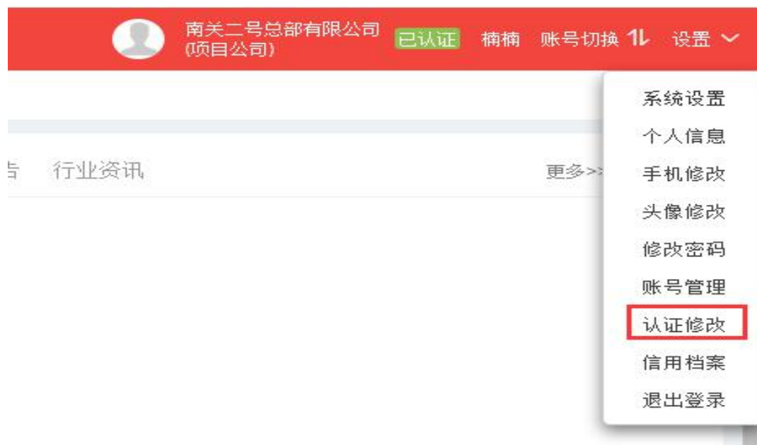
图 5 认证

用户可通过右上角“设置”--“认证修改”补充完善用户信息，并对已认证信息进行更新、修正等操作。认证修改的表单与首次认证的表单一致，此处不再赘述。