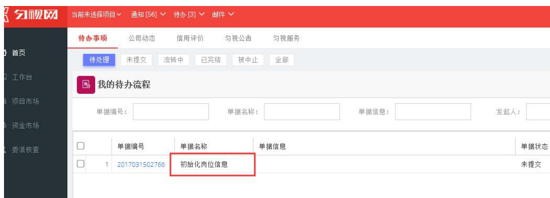
图 1 初始化岗位信息

第一步：用户通过认证后，系统自动生成《初始化岗位信息》，显示在“工作台-待办事项”中