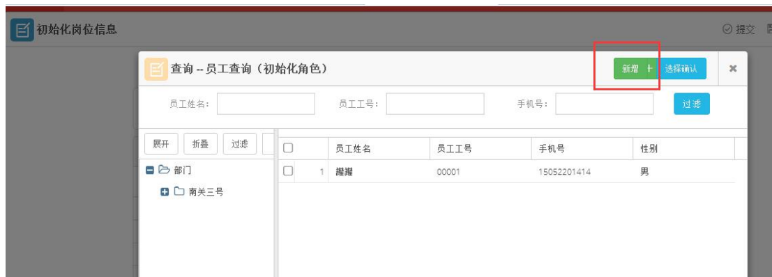
图 3 初始化岗位信息