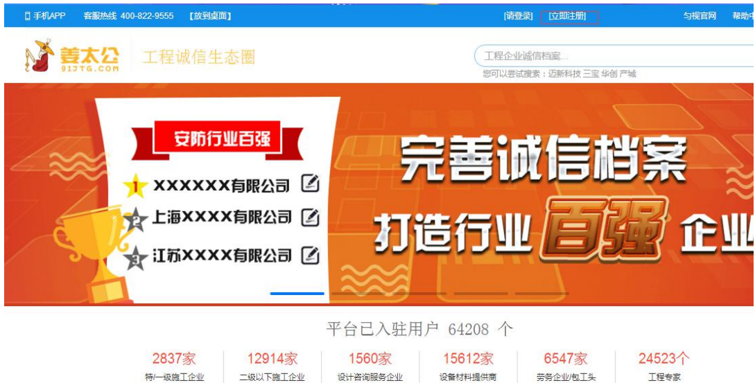
图 1 注册