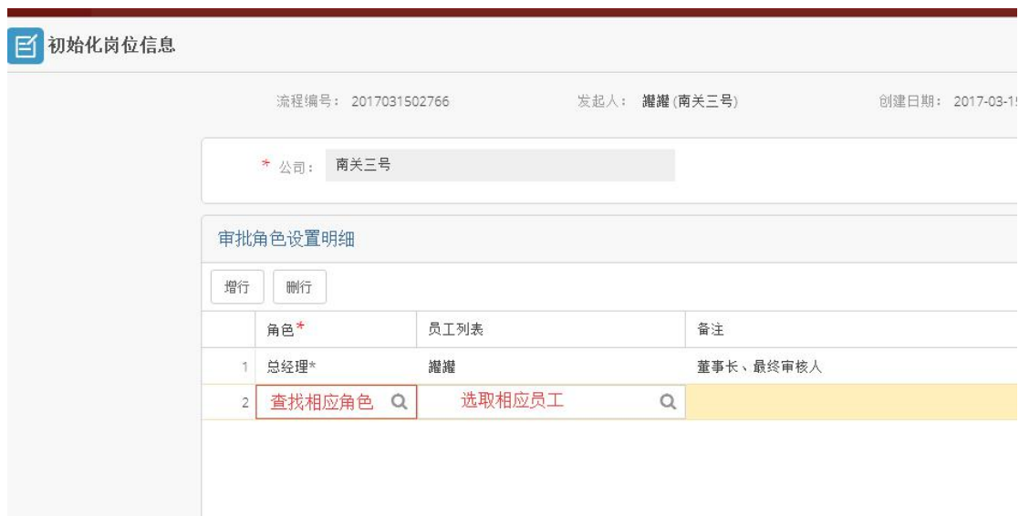
图 2 初始化岗位信息